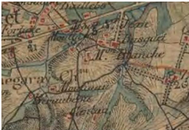
Carte d'état-major 1852