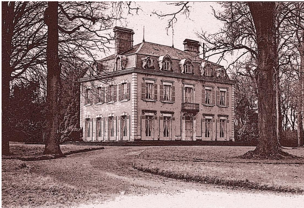
Vue depuis le Nord Est 1906